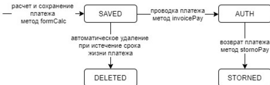
Диаграмма изменений статусов